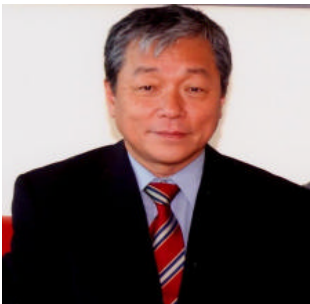
Dr. JONG-WOOK LEE D. G DE L'OMS