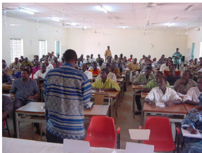
Des conférences ont été données dans les écoles régionales de santé publiques