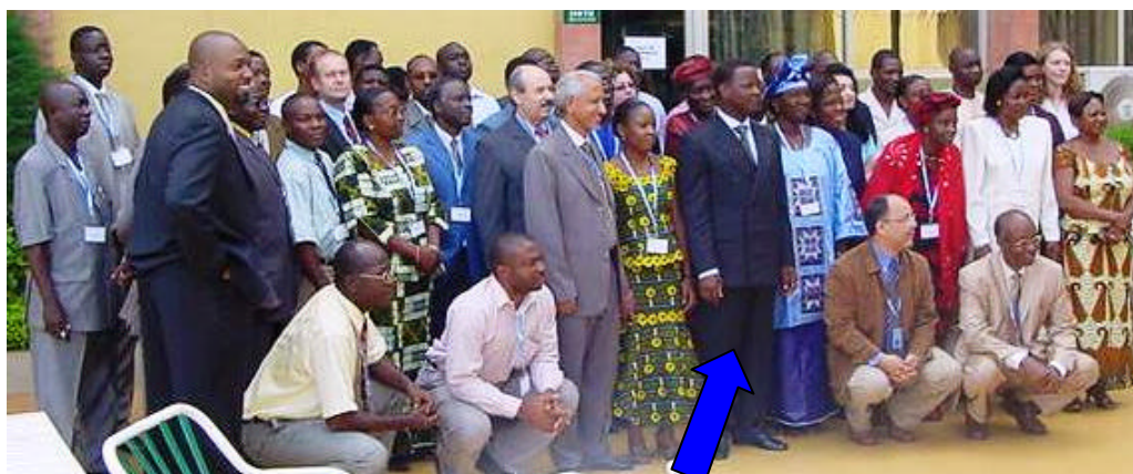
Photo de famille à l'issue de la cérémonie d'ouverture en présence du Ministre de la Santé du Burkina

L'atelier de planification pour le renforcement des autorités nationales de régulation qui s'est tenu du 23 au 27 mai 2005 après des échanges jugés fructueux.