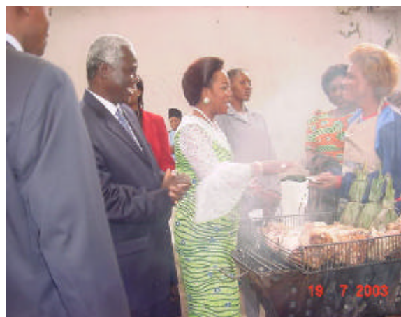
Mme l'épouse du Chef de l'Etat (au centre) faisant son marché en compagnie du Représentant de l'OMS au Congo (à sa droite) lors de l'exposition vente

Après six mois de campagne, il est aisé de constater que le concept « marché - santé » retient désormais l'attention des autorités nationales et de la population congolaise en général. Ainsi, le Gouvernement de la République du Congo a, au cours de son conseil de ministres