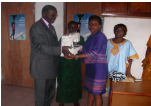
Remise du don à la présidente de la SWAA

La lutte contre le VIH/SIDA est basée sur une synergie entre tous les acteurs communautaires, qui développent des passerelles nécessaires pour que la population puisse avoir accès à des services de proximité.