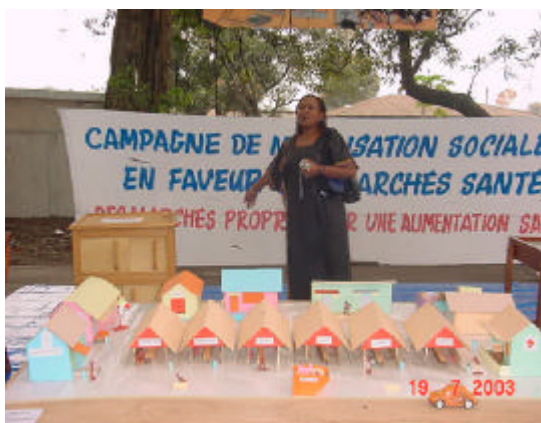
Maquette d'un marché santé

Le marché en miniature présenté sur la maquette a mis en relief les éléments constitutifs d'un marché - santé à savoir : des voies d'accès, un plancher en matériaux lavables, des points d'eau, des ouvrages d'assainissement notamment les installations sanitaires, les caniveaux, les poubelles placées en des endroits faciles d'accès, des allées non encombrées, des hangars aérés, des magasins de stockage des vivres frais, des magasins de stockage d'autres vivres, des dispositifs de lutte contre les incendies (bouches d'incendie, extincteurs placés en des lieux appropriés), un poste de santé, un poste de police et bureau du comité du marché.