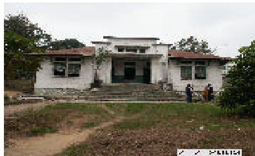
Le Centre National de Médecine Traditionnelle à Brazzaville