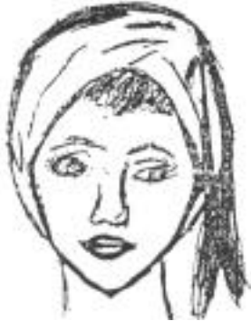
Type IV : en diamant

* Type IV, Type V : «Type digestif» Visage en forme de diamant, visage rond.