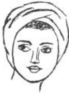
Type V : Rond

* Type VI «Type cérébral» Visage triangulaire à base étroite ou en forme de cœur.