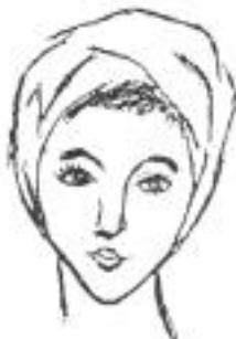
Type VI : Coeur

* Type VI «Type cérébral» Visage triangulaire à base étroite ou en forme de cœur.