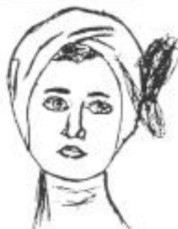
Type VII : Poire

* Type VII «Type respiratoire» Visage triangulaire à base large ou forme de poire.