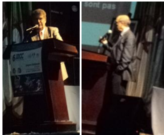
Prs. Gerbaulet & Beuzeboc

chirurgie (pour la tumeur primitive qui peut aller de la circoncision à l'amputation de la verge et pour les ganglions : curage inguinal, pelvien voire lombo-aortique) et à la chimiothérapie. L'orateur traitera de la radiothérapie externe de la tumeur primitive et des ganglions et surtout de la curiethérapie interstitielle et de contact de faible et de haut débit de dose. L'orateur fera une description détaillée du GAG (gland applicateur de Gerbaulet) qu'il a mis au point. La survie globale à 5 ans pour la chirurgie (40 à 76 % selon les équipes) ainsi que celle de la radiothérapie (66% dans l'étude multicentrique française) dont le taux de conservation de la verge est plus élevé sont rapportés. Pour le Pr. Gerbaulet, la curiethérapie interstitielle par Iridium 192 tient un rôle important dans le traitement à visée conservatrice du cancer de la verge à condition que la technique soit bien maîtrisée, les règles de dosimétrie respectées, et les indications bien posées : tumeur limitée au gland, ne dépassant pas le sillon ballano-prépuce. Le traitement ganglionnaire est chirurgical +/- complété par radiothérapie ou radio-chimiothérapie.